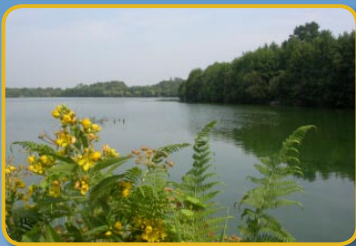
Étang de Loscouët

En 1999, il existe 5 grands sites nautiques : 4 plans d'eau importants (Gaël, Iffendic avec l'étang de Trémelin, Chavagne, Saint-Gilles), une base de loisirs nautiques à Montfort-sur-Meu et des plans d'eau communaux pour la détente.