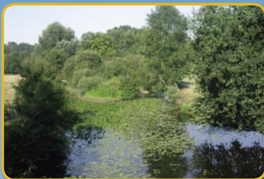
Le Meu à Talensac